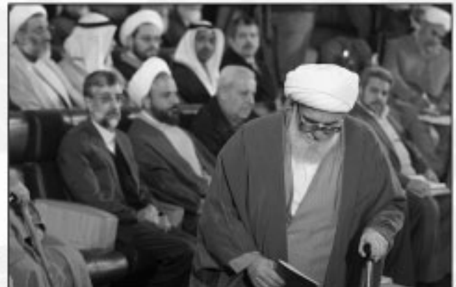
دوستان همایش بین‌المللی بزرگداشت ابن‌حسین بحرانی