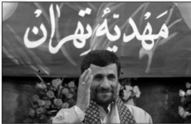
دکتر احمدی نژاد در مهدیه تهران