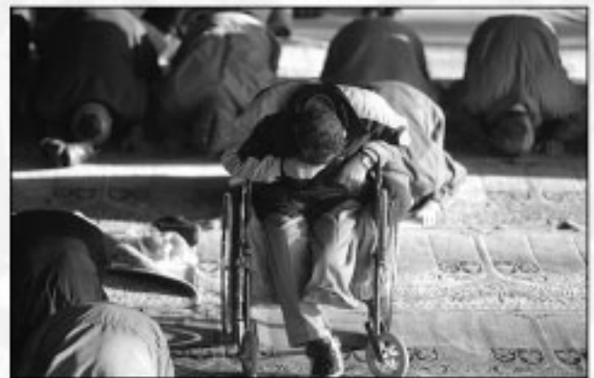
برگزاری نماز جمعه در تهران