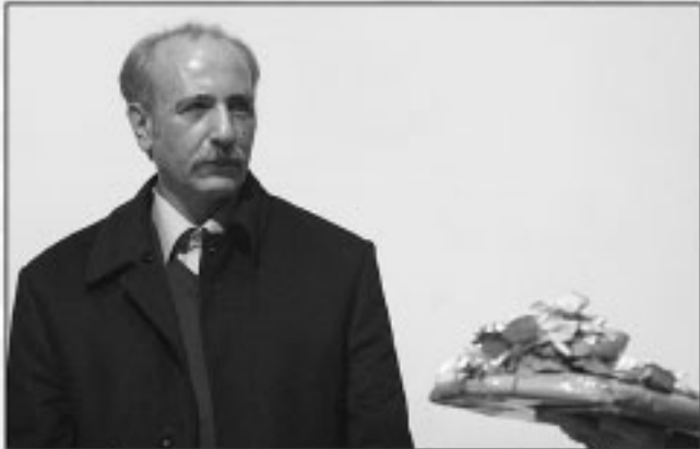
بزرگداشت استاد بهاء‌الدین خرمشاهی مترجم و پژوهشگر قرآن